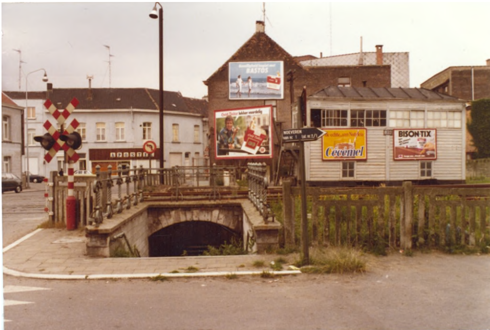
Zicht op de oude spoorwegovergang Nielsestraat-Vrijheidstraat. Net voor de voetgangerstunnel de wegwijzer naar Noeveren nr. 1 tot nr.2/1

Iets lager dan dit pad liep een bredere aarden weg die rijkelijk voorzien was van kuilen. De ophanging van het voertuig dat zich een weg baande naar Noeveren nr.1, 2 of nr.2 “kleine 1”, werd danig op de proef gesteld. Met stenen werd er voor gezorgd dat de weg min of meer berijdbaar bleef. De grijze stenen van het type dat “en masse” wordt gebruikt als spoorwegbedding, werden in de aarden weg gedrukt door de zwaar beladen vrachtwagens die van de iets verderop gelegen werf van “meneer Van den Bossche” kwamen.