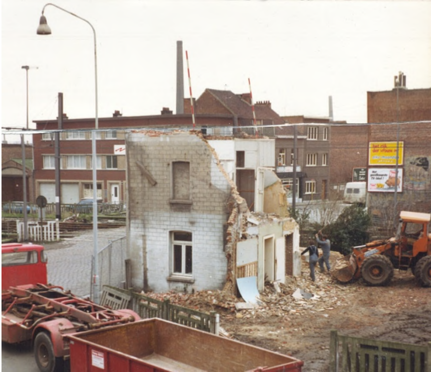
Slopingwerken Vrijheidstraat 72 in juni 1983

Het contrast Boom-Mortsel was zelfs zo groot – je kan het haast een cultuurschok noemen – dat we amper een jaar later terug naar Boom verhuisden. Onze nieuwe thuis was gelegen in de Vrijheidstraat nr.72. Het huis werd in 1983 afgebroken. Het stond vlak voor de spoorwegovergang Vrijheidstraat-Nielsestraat. Vanuit mijn slaapkamervenster zag ik recht in “Blok 23” van waaruit de bareel en de wissels nog manueel werden bediend 4 .